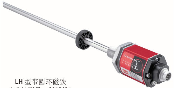
LH 型带圆环磁铁 (磁铁型号: 201542)